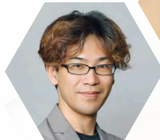
NTTデータ コンサルティング事業本部 コンサルティング事業部 ビジネス&サービスデザインユニット エグゼクティブイノベーションエコシステムデザイナー/部長