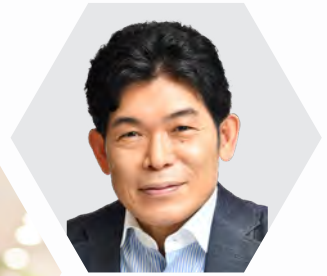
東京大学 大学院経済学研究科・経済学部 教授