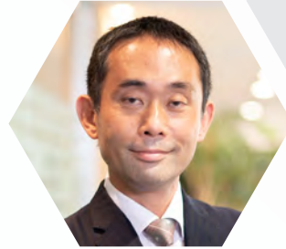
NTTデータ 金融イノベーション本部 イノベーションリーダーシップ統括部 統括部長