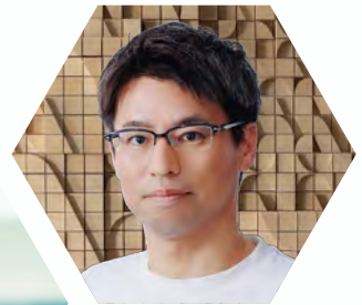
NTTデータ 社会基盤ソリューション事業本部 社会DX&コンサルティング事業部 部長