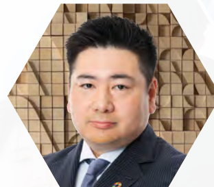
NTTデータ テクノロジーコンサルティング事業本部 企画部 企画部長

日本国内のBPS(ビジネスプロセスサービス)は他国に比べて限定的でしたが、近年では労働力人口の減少や生成AIの進化により、BPSの重要性が増しています。持続可能な成長を目指す企業において鍵となるのは、BPSの新しい潮流とその効果的な活用です。最新のBPS市場トレンドやビジネス効率を最大化する先進的手法、AIと人間の協働がBPSに与える影響について考察し、事例を通じてビジネスプロセスの改善と持続可能な成長の実現方法を解説します。攻めのBPSや業務プロセスのデジタル化、デジタル従業員の活用も含め、企業の成長戦略に役立てていただける講演です。