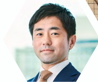
NTTデータ 経営研究所 ビジネストラansフォーメーションユニット アソシエイトパートナー/クロスクリエイショングループ長

デジタル先進国であり、幸福度やサステナビリティへの取り組みでも高い評価を得ているデンマーク。その成功の秘訣は社会システム・まちづくりのデザイン、AI倫理・ガバナンス、市民参画を重視した「人間中心のデジタル社会」です。日本のデジタル社会の課題とは何か？日本がデンマークの事例から学び、「人間中心のデジタル社会」実現に向けたポイントを紹介します。また、近い将来に訪れる超デジタル化社会では、個人の個性や属性データを自己主権下で管理・活用する次世代のデジタルIDインフラが求められます。商品企画やマーケティング、コミュニティ形成などを事例に取り上げ、さまざまな側面からの社会課題の解決について解説します。